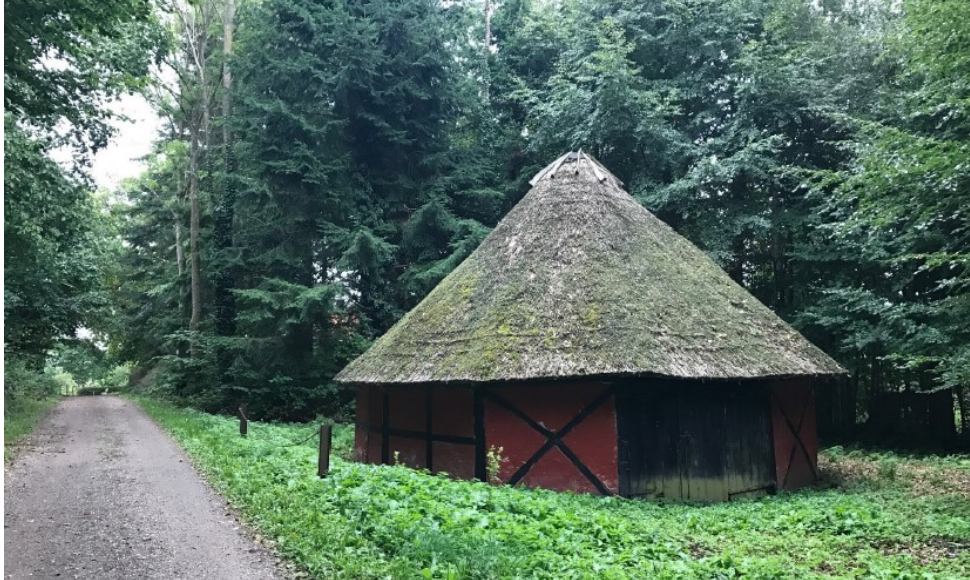
Figur 1, billede af bygningen fra ansøgningen

lille thekøkken. Stueplanet er på 42 m 2 . Bygningen forsynes med en hems på 11 m 2 der indrettes til ophold. Der opføres skorsten, så bygningen fremadrettet kan opvarmes.