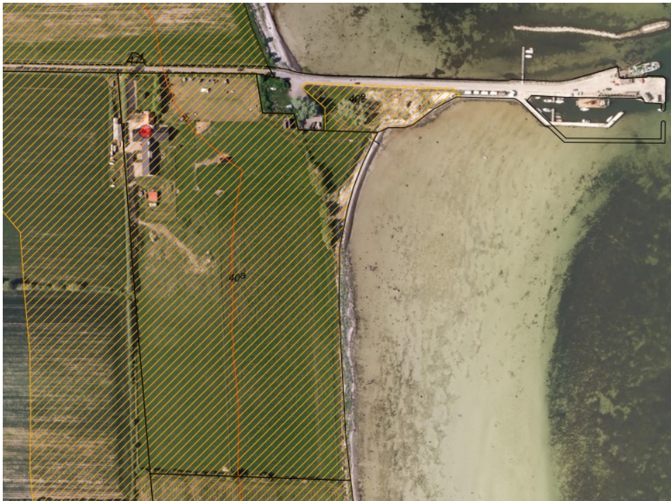
Fig. 1 Ortofoto 2019. Den røde prik markerer ejendommen. Det orange skraverede område markerer det strandbeskyttede areal. Den røde streg markerer den oprindelige strandbeskyttelseslinje. De sorte streger markerer matrikelskel.

Autocamperpladsen ønskes placeret oppe ved bygningerne der er beliggende i den udvidede del af strandbeskyttelseslinjen, der trådte i kraft den 25. november 2001 i Fyns Amt. Se figur 1 kort er viser strandbeskyttelseslinjen og figur 2 der viser den ønskede placering.