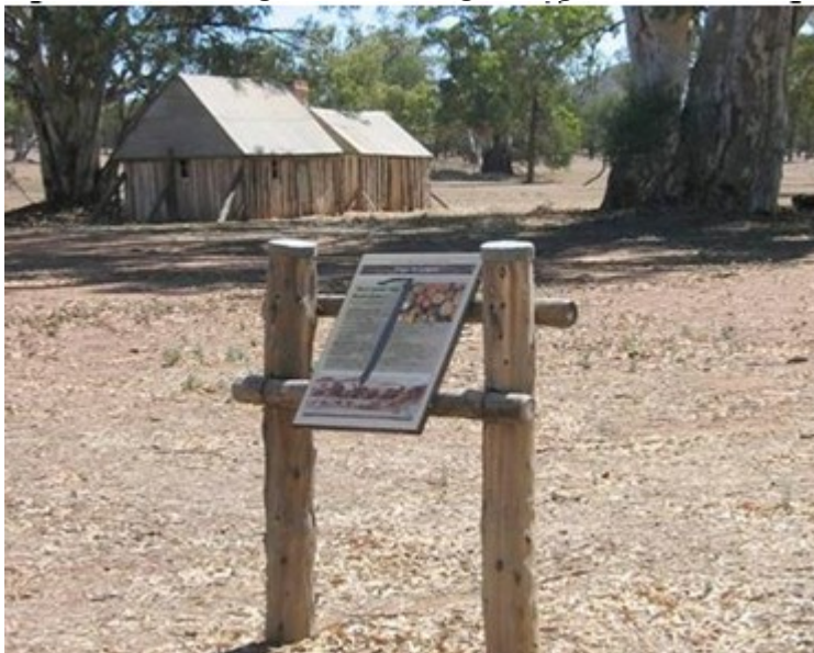
Fig. 3. Billede fra ansøgningen, der viser den ønskede udformning af informationsskiltet.

Det ønskede informationsskilt ønskes opført med en A2 plade på to stolper. Den ønskede udformning af skiltet fremgår af figur 3.