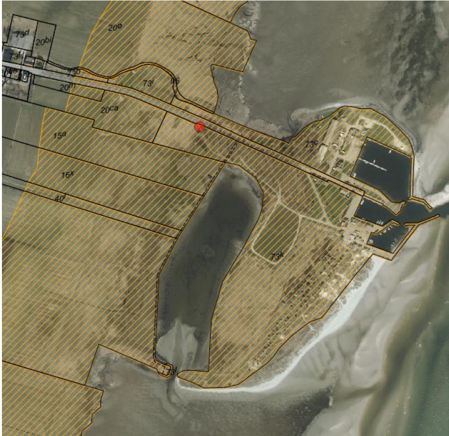
Fig. 1 Ortofoto 2019. Den røde prik markerer placeringen af informationsskiltet og oplevelsesrammen. Det orange skraverede område markerer det strandbeskyttede areal. De sorte streger markerer matrikelskel.

Ejendommen er beliggende henholdsvis i byzonen og landzonen. Ejendommen er i sin helhed beliggende inden for strandbeskyttelseslinjen. Se figur 1.