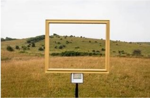
Fig. 4. Billede fra ansøgningen, der viser den ønskede udformning af oplevelsesrammen.

Den 20. maj 2020 sendte Kystdirektoratet en foreløbig vurdering af projektet, hvor det blev tilkendegivet at der kunne opnås dispensation til informationsskiltet, mens der blev varslet afslag til oplevelsesrammen, da det efter Kystdirektoratets vurdering er tale om kunst.