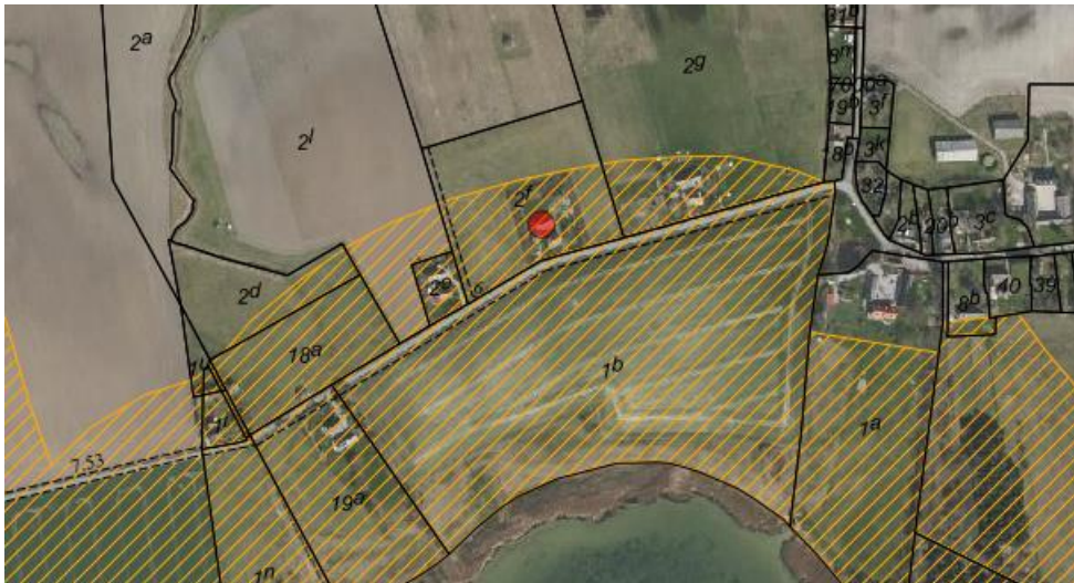
Fig. 1. Ortofoto 2019. Den røde prik markerer ejendommen. Det orange skraverede område markerer det strandbeskyttede areal. De umatrikulerede arealer ud til kysten samt stranden er dog også omfattet af bestemmelserne om strandbeskyttelse. De sorte streger markerer matrikelskel.

Garporten ønskes genopført efter stormskade på den gamle carport. Vordingborg Kommune har af ansøger fået oplyst, at carporten er blevet nedtaget i 2020. I forbindelse med ansøgningen har Vordingborg Kommune endvidere oplyst, at den gamle carport er svær at få øje på pga. beplantningen på ejendommen.