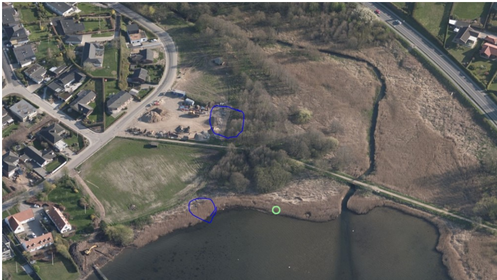
Omtrentlig markering af bassin og grøft