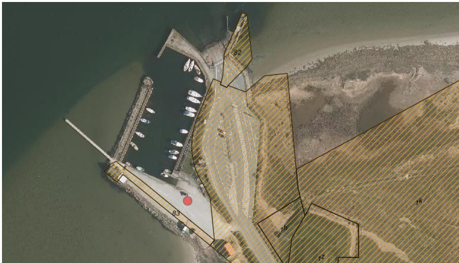
Fig. 1. Ortofoto 2019. Den røde prik markerer parkeringspladsen, der ønskes renoveret. Det orange skraverede markerer det strandbeskyttede areal. De umatrikulerede arealer ud til kysten samt parkeringspladsen er dog også omfattet af bestemmelserne om strandbeskyttelse. De sorte streger markerer matrikelskel.

Ifølge ansøgningen ønskes parkeringspladsen renoveret, da den tit ligger under vand, hvorfor den hælder flere steder samt har mange vandhuller ved højvande. Parkeringspladsen benyttes i vinterperioden til opbevaring af både, hvorfor det er vigtigt, at terrænet er plant. Arealet som ønskes renoveret kan ses på fig. 2.