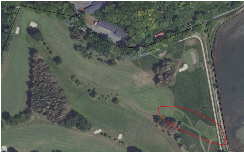
Luftfoto af området indsat fra SagsGIS. De nye teesteder er markeret med rødt. Nord for ses den nu nedlagte 16. green. Stien langs vandet ses til højre.

Kystdirektoratet har i 2018 givet dispensation til at omlægge 16. og 17. hul på golfbanen, herunder anlægge ny green og nye teesteder på hul 16 (j.nr. 17/03382). Dispensationen blev givet under henvisning til blandt andet hensynet til sikkerheden for de gående på en offentlig sti langs vandet. I forlængelse heraf har Korsør Golfklub anlagt nye teesteder til hul 17. Disse var ikke omfattet af ovennævnte ansøgning og afgørelsen til denne.