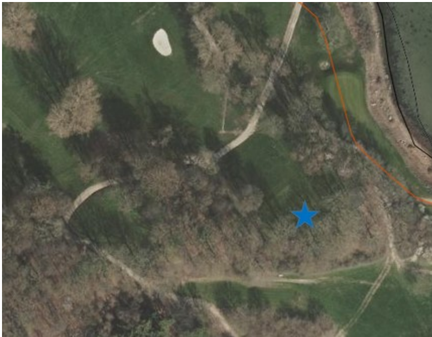
Luftfoto af området. Greenen er markeret med en blå stjerne. Kysten og den oprindelige strandbeskyttelseslinje ses øverst til højre (mod nordøst). Indsat fra SagsGIS

Terrænet skråner ned mod nordvest, så der i dag er en niveauforskel fra greenens forkant til bagkant på ca. 1,5 meter. Der søges om at fjerne jord fra den øverste del af den nuværende green, og fylde det på det areal, der skal være green fremover, for at undgå store niveauforskelle på den nye green.