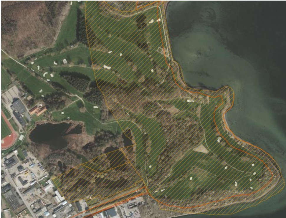
Luftfoto af golfbanen. Det strandbeskyttede areal er markeret med skravering. Den oprindelige strandbeskyttelseslinje ses som en orange linje.

En stor del Korsør Golfklubs bane er strandbeskyttet. En mindre del af golfbanen ligger desuden inden for den oprindelige 100-meter-linje.