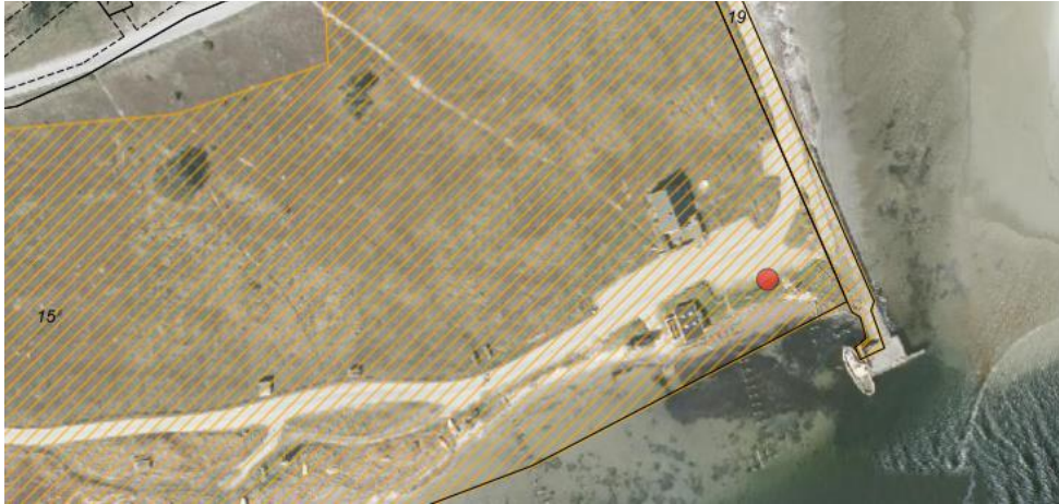
Fig. 1. Ortofoto 2019. Den røde prik markerer området, hvor de ansøgte forhold flyttes samt vej- og parkeringsarealet befæstes. Det orange skraverede område markerer det strandbeskyttede areal. De sorte streger markerer matrikelskel.

Det fremgår af ansøgningen, at stedet på ovennævnte matrikel i mange år har været anker- og landingsplads for mindre joller til fiskeri i Mariagerfjord (se fig. 1).