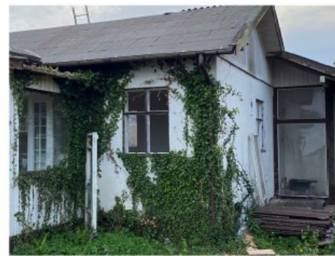
Foto fra ansøgningen, der viser det eksisterende hus. Strandbeskyttelseslinjen går omtrentligt hvor stigen står på fotoet nederst til venstre.

Bygningen nedrives, hvilket kan gøres uden dispensation fra strandbeskyttelseslinjen, og der ønskes opført en bolig, hvor en del opføres inden for strandbeskyttelseslinjen.