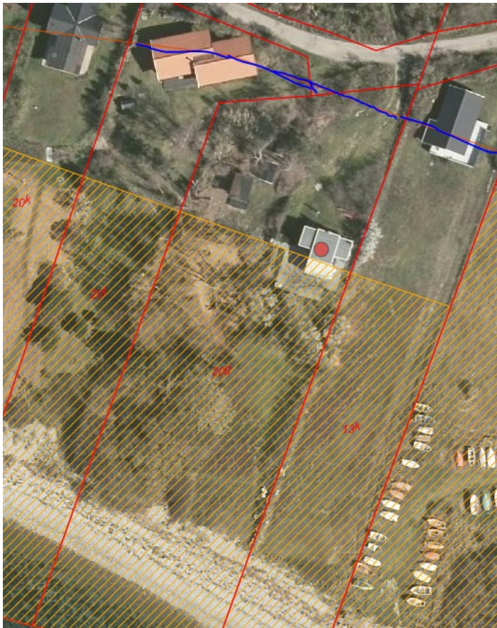
Strandbeskyttelseslinjen skraveret/ tidligere 100 m linje gældende indtil 2001 markeret blå