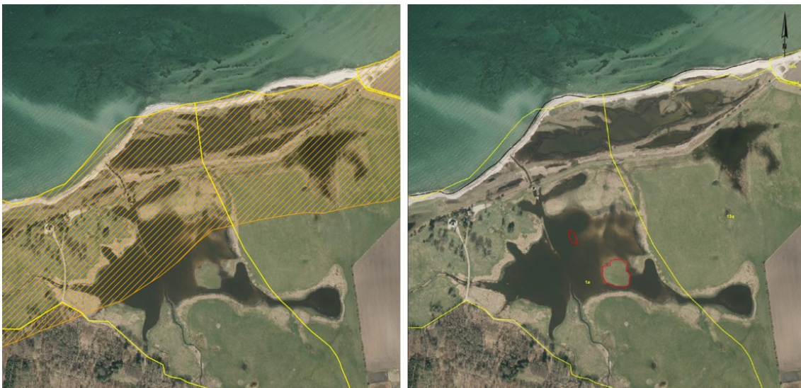
Figur 2. Kortudsnittet til venstre viser strandbeskyttelseslinjens forløb i området (strandbeskyttede arealer er vist med orange skravering). På kortudsnittet til højre er de ansøgte fugleøer markeret med røde omrids. Bemærk, at kun den nordligst beliggende fugleø er omfattet af strandbeskyttelseslinjen.