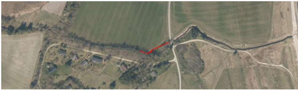
Del inden for strandbeskyttelseslinjen – rød markering

Ejendommen er beliggende i/op til Natura 2000-område nr. 16 - Løgstør Bredning, Vejlerne og Bulbjerg (habitatområde nr. 16, fuglebeskyttelsesområde nr. 12), jf. bekendtgørelse nr. 1595 af 6. december 2018 om udpegning og administration af internationale naturbeskyttelsesområder samt beskyttelse af visse arter.