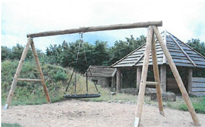
Eksempelvisning af legeredskaber. Indsat fra ansøgningen.

Der løber i området en kloakledning, og der er deklareret et forbud mod gravearbejder i en afstand af 2 meter fra ledningen. Det er Skive Vand A/S, der har påtaleretten for deklARATIONEN. Ansøger har aftalt med Skive Vand A/S, at Skive Vand A/S deltager ved opførelsen af legepladsen med henblik på at sikre, gravearbejdet ifm med anlæggelse af legepladsen ikke beskadiger kloakledningen.