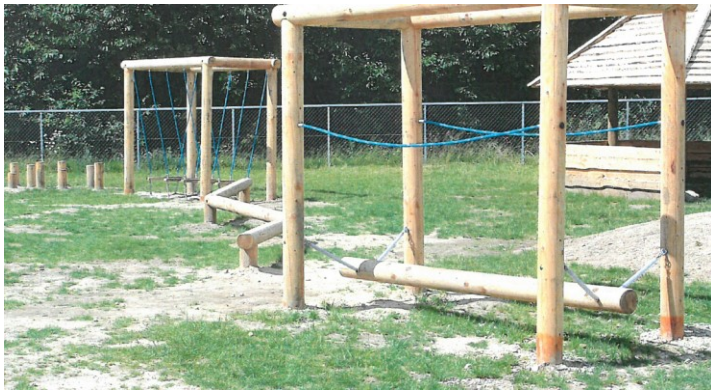
Eksempelvisning af legeredskaber. Indsat fra ansøgningen.