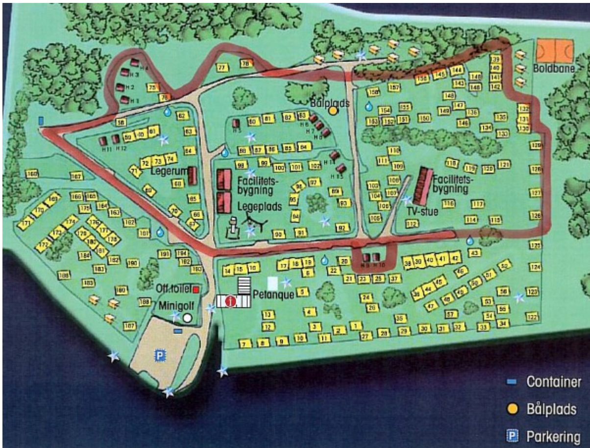
Nuværende tilladelse til vintercampering