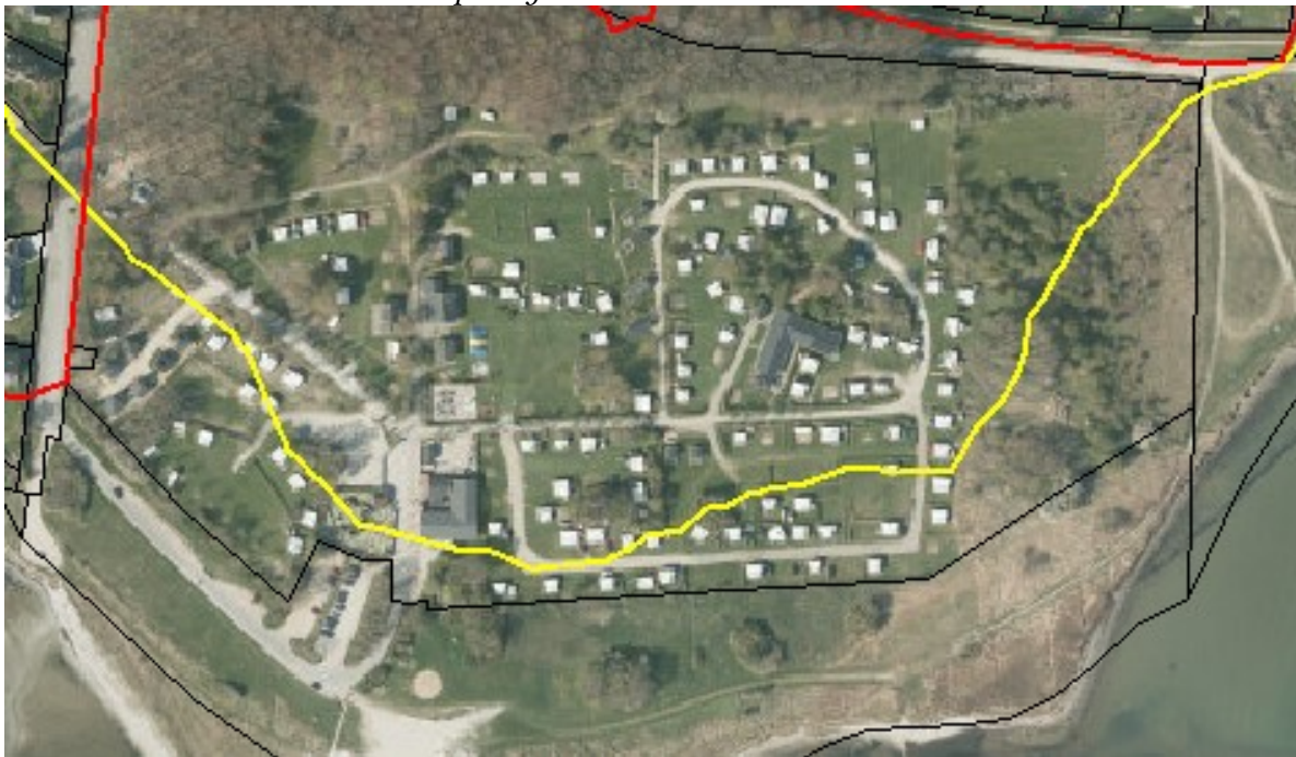
Kortklip med markering af den oprindelige strandbeskyttelseslinje på ejendommen