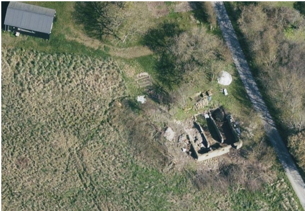
Foto af bygningen. Indsat fra ansøgningen.

Ombygningen/renoveringen indebærer et renovere murene og lægge et tag over, så bygningen kan udgøre læskur for alpaka. Eftersom murene er i for dårlig stand til at bære taget, søges der om at montere taget på nye stolper, der placeres inden for de eksisterende mure, så stolperne ikke kan ses udefra. Taget laves af trapezplader med en hældning på 5 grader.