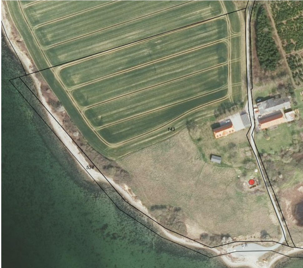
Luftfoto af ejendommen. Resterne af pakhuset/stalden ligger ved den røde prik.

af bygningen, så den fremover kan bruges som læskur for 5-7 alpaka. Ejeren skriver i ansøgningen, at bestanden på sigt forventes at vokse.