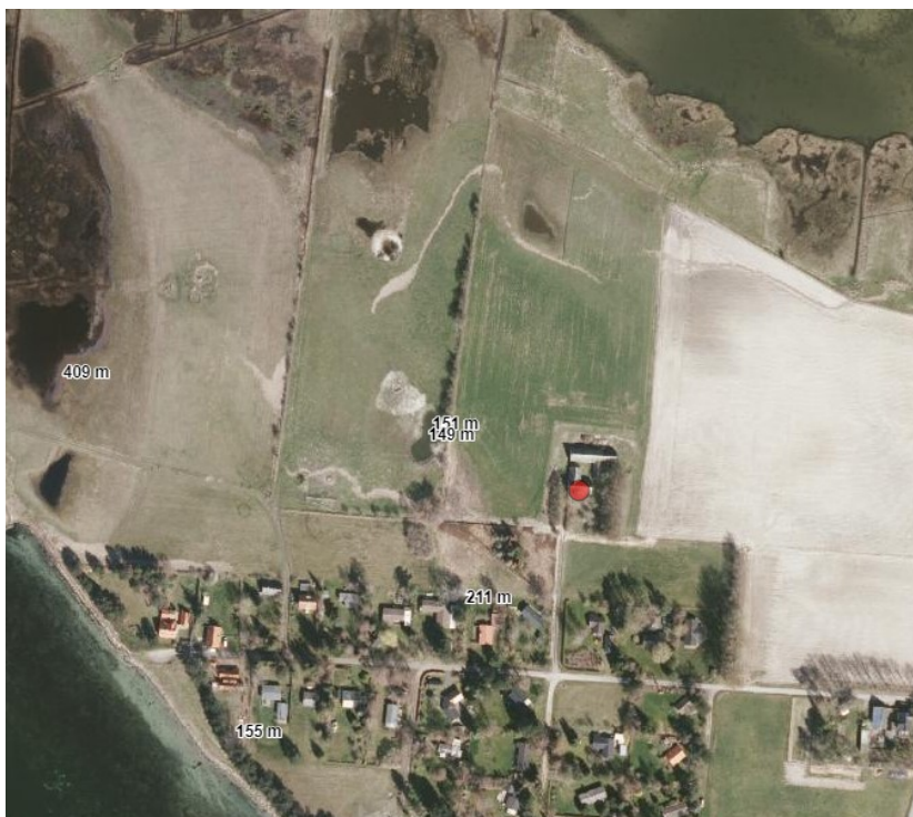
Bebyggelsens placering (med bebyggelse der fjernes)