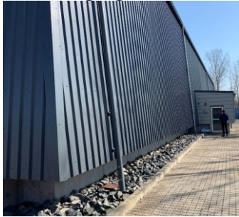
Foto af facade mod syd

Facader og tag vil være identisk med de nuværende forhold, jf. foto.