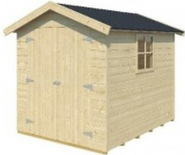
Fig. 3. Skitse af det ansøgte muldtoilet.

taget. Bygningen vil blive malet i enten jordfarver eller sort. Skitse af det ansøgte muldtoiletet kan ses på fig. 3.