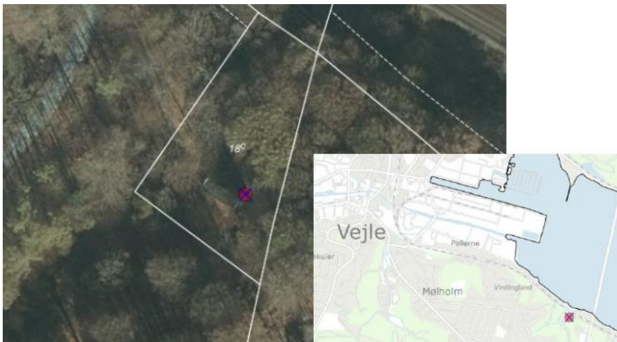
Fig. 2. Den røde prik med blåt kryds markerer placeringen af toiletet.

Det fremgår af ansøgningsmaterialet, at muldtoiletet ønskes opsat i tilknytning til ejendommens eksisterende spejderhytte på 40 m 2 , hvor der på nuværende tidspunkt hverken er indlagt vand, varme eller el. Placeringen af muldtoiletet kan ses på fig. 2.