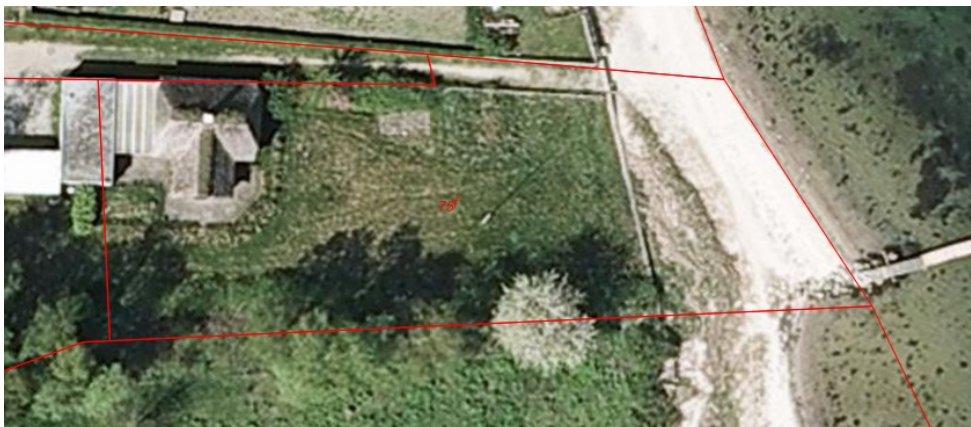
Ejendommen 2008 – haveareal