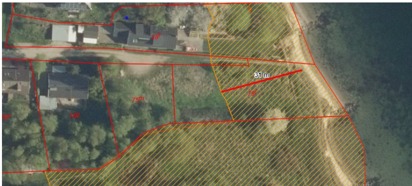
Oversigt over ejendommen med strandbeskyttet areal