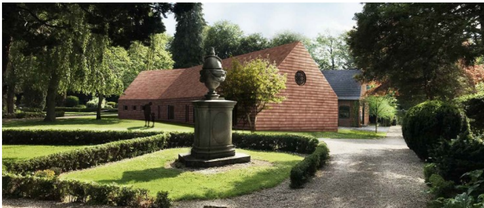
Visualisering – ny bebyggelse over –”eksisterende forhold under”