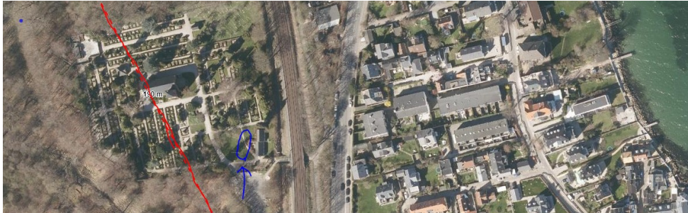
Ny bebyggelse (blå) –sStrandbeskyttelseslinje (omtrentlig linjeføring rød)

Menighedsrådet anfører, at den planlagte placering af det nye projekt ikke er væsentlig forskellig fra det tidligere ansøgte og godkendte. Det er dog ændret på en del områder bl.a. er bygningen vinklet og delvist nedgravet, så menighedsrådet formoder, at en ny dispensation fra strandbeskyttelseslinjen er nødvendig.