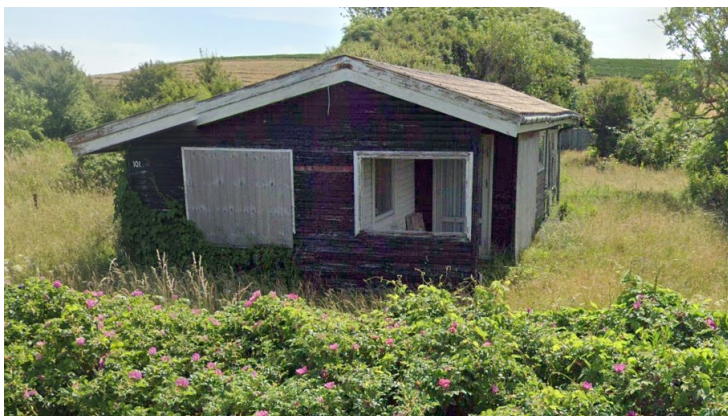
"O.T." arealer vist med rød markering