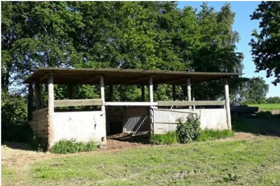
Foto fra forespørgslen, der viser læskurets udseende.

Der foreligger ikke en nærmere redegørelse for kvægholdets størrelse eller krav til læskurets størrelse.