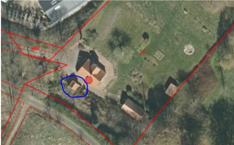
Figur 2, skur der genopføres indtegnet i blå streg, øvrige bygninger fjernes