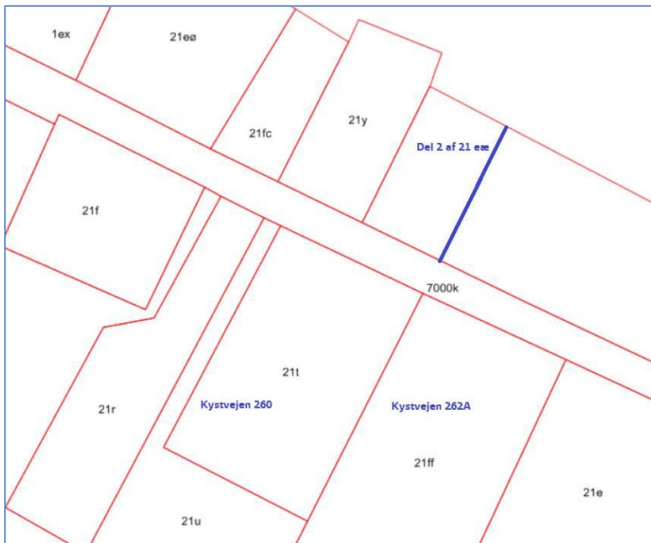
Figur 2. Kortudsnit fra ansøgningen. Den blå streg viser det nye matrikelskel, som den ansøgte arealoverførsel vil medføre.

Der er ansøgt om arealoverførsel af et areal på 230 m 2 fra matr. nr. 21eæ Strøby By, Strøby til matr. nr. 21y Strøby By, Strøby, således at skellet kommer til at ligge som en forlængelse af skellet mellem matr. nr. 21t og 21ff på den anden side af Kystvejen, se figur 2.