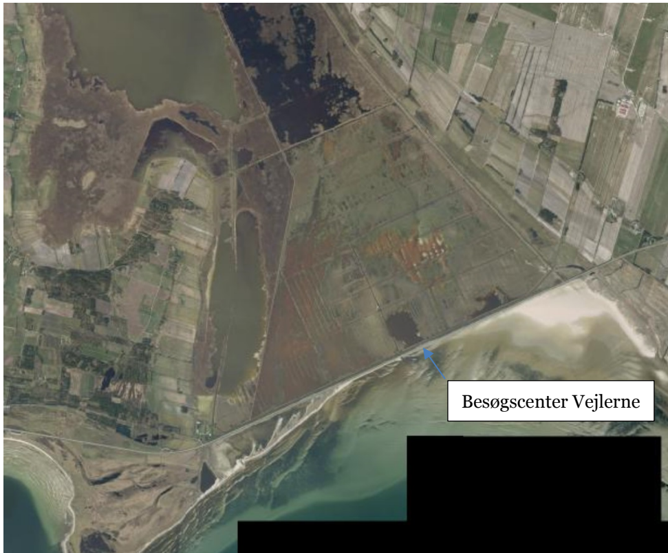
Figur 1. Orthfoto over Byholm Vejle.

Jammerbugt Kommune har, på vegne af Ørebro Erhvervsforening, den 19. april 2016 ansøgt om udvidelse af besøgscenter Vejlerne.