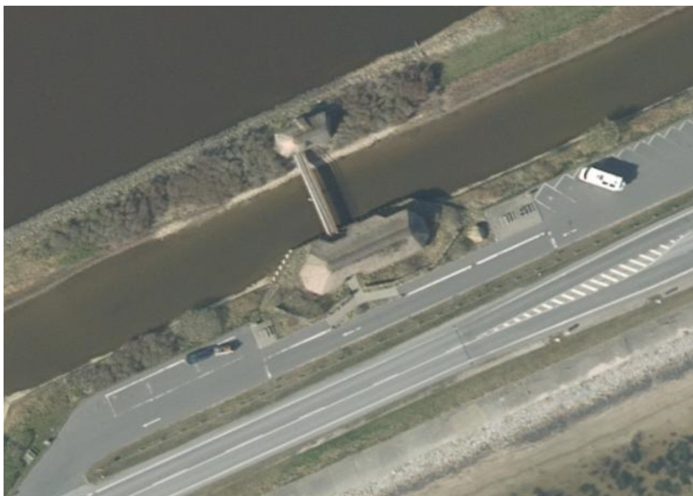
Figur 2. Orthofoto over Besøgscenter Vejlerne

I ansøgningen søges om udvidelse af besøgscenter Vejlerne beliggende Bygholmvejlevej 640, 9690 Fjerritslev. Udvidelsen skulle være en selvstændig bygning med omtrent samme udformning som det eksisterende besøgscenter, som det fremgår af nedenstående figur 2