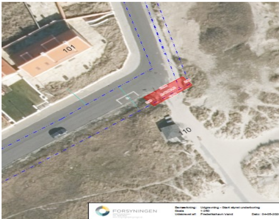
Figur 2. Placering jf. ansøgning af modtagegrube øst for havnen.