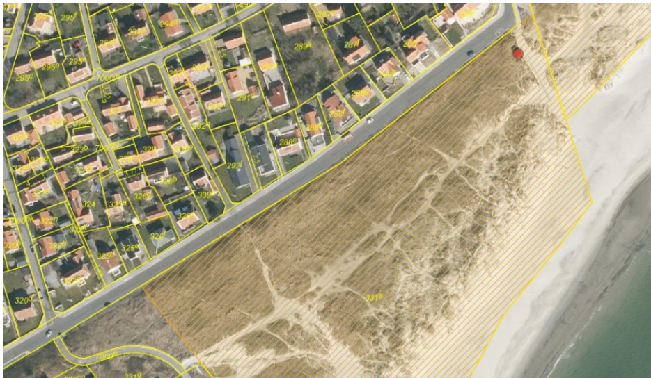
Figur 1. Strandbeskyttelseslinjen er markeret med gul skravering.

Jf. ansøgningen placeres målerskab samt den anden modtagegrube uden for strandbeskyttelseslinjen, hvorfor placering af disse ikke er behandlet i ansøgningen.