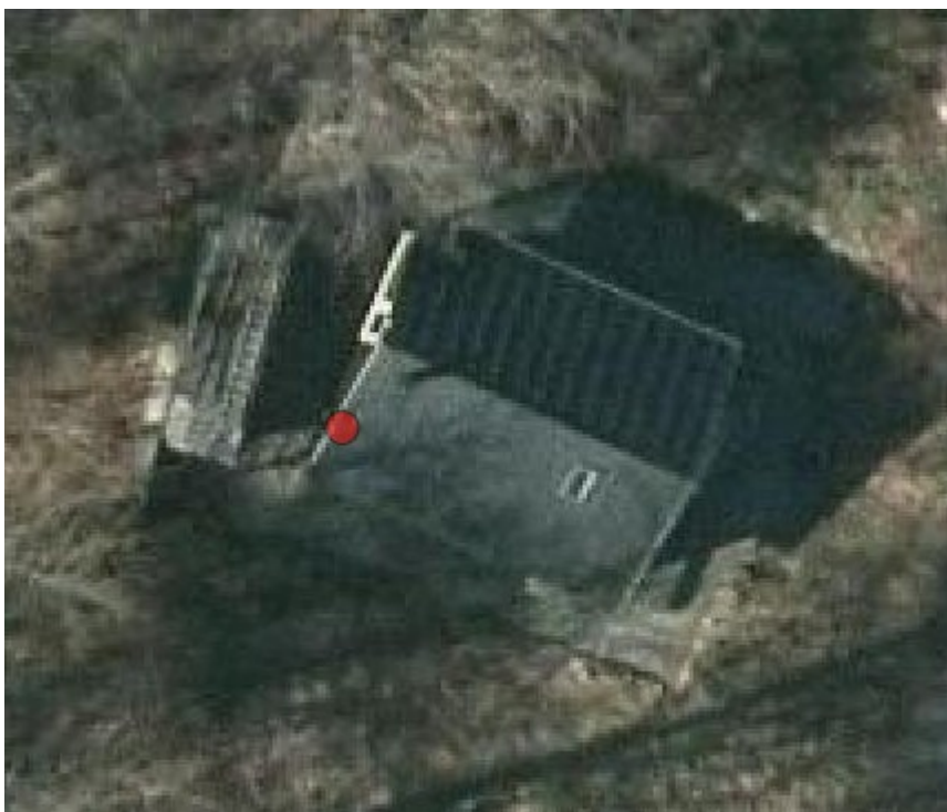
Luftfoto fra 2013, der viser det gamle skur.