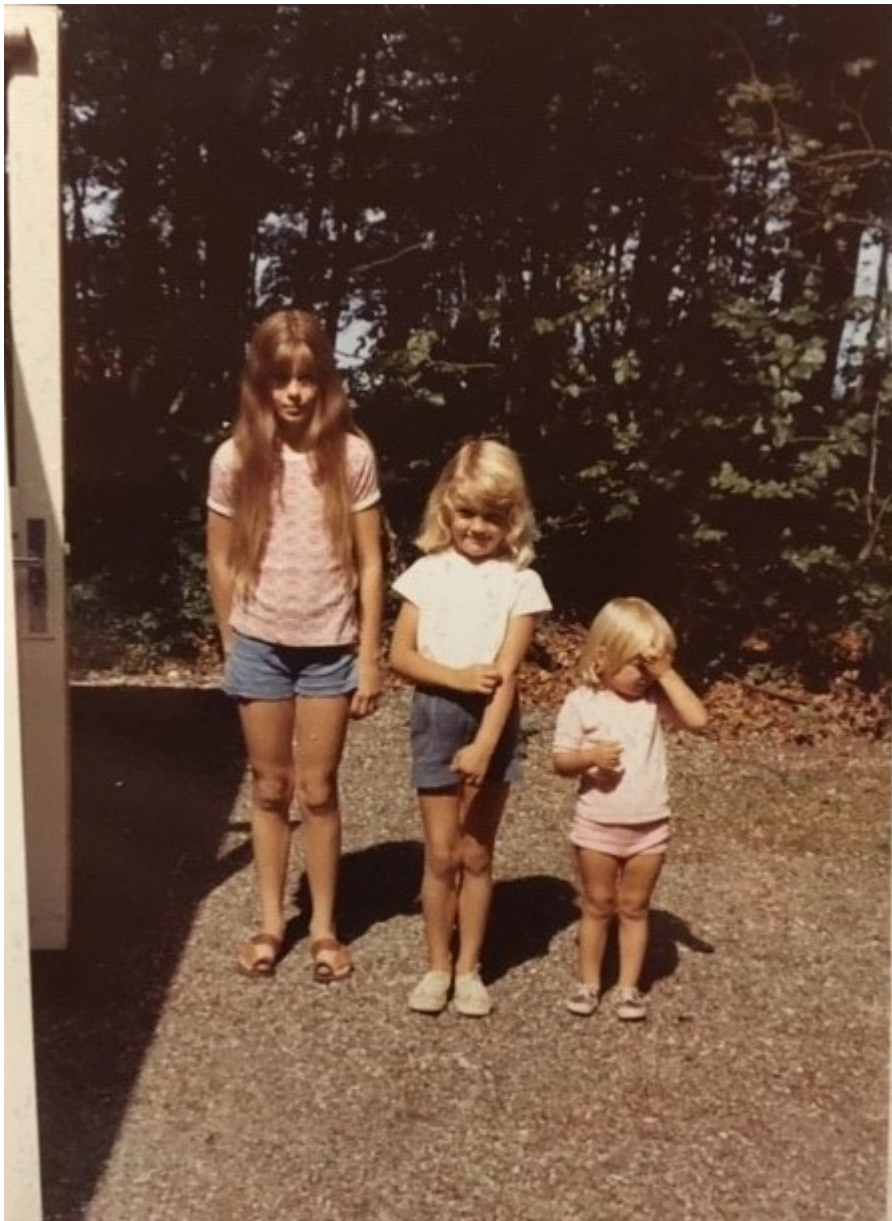
Foto fra huset, der viser søsten som belægning. Fotoet er efter det oplyste fra 1970'erne. Indsat fra ansøgningen.