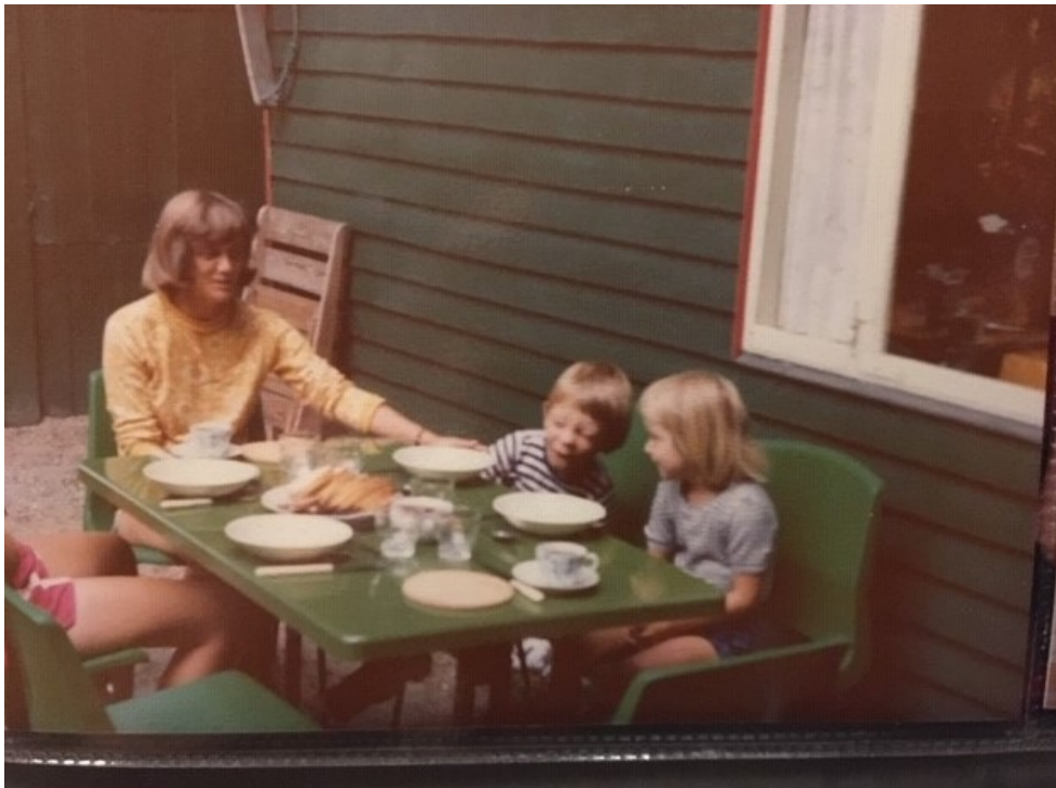
Foto fra huset, der viser en belægning og anvendelsen som terrasse. Fotoet er efter det oplyste fra 1970'erne. Indsat fra ansøgningen.