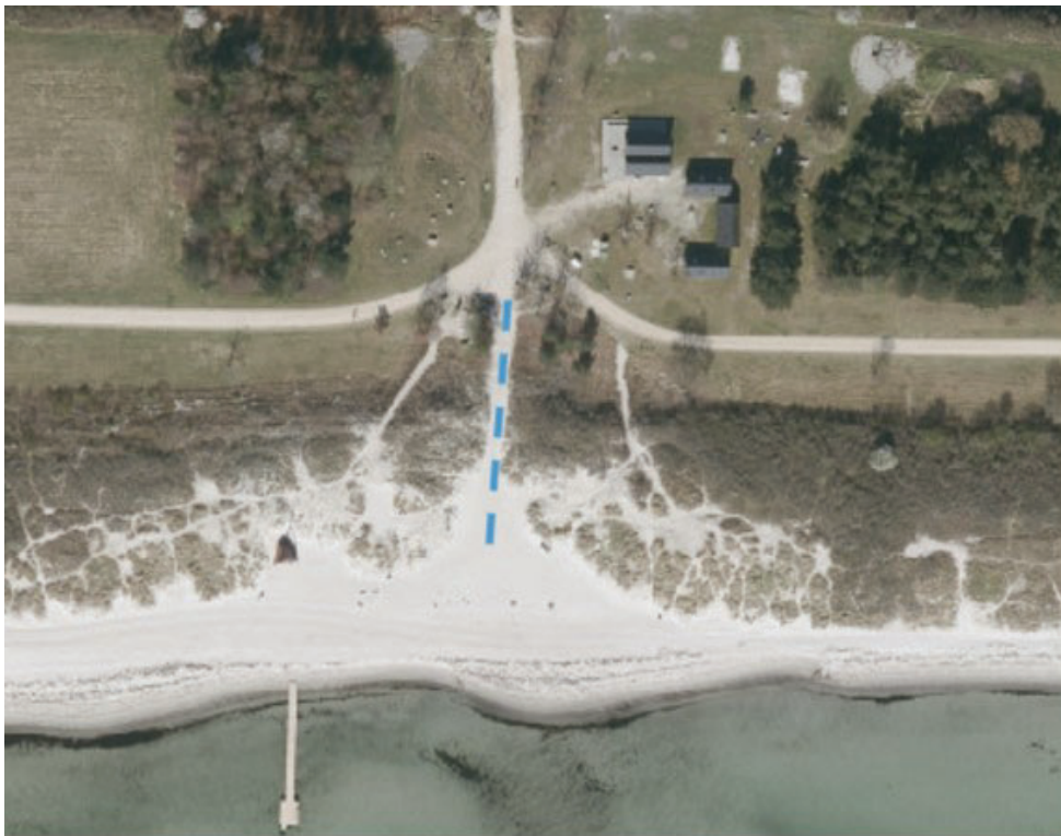
Fig.1 Oversigtskort over Brøndby Strand, den blå stiplede streg indikerer placeringen af strandtæppet

Strandtæppet (figur 3 og 4) bliver 2 meter bredt og 50 meter langt. Dog starter forløbet af strandtæppet med en bredde af 4 meter.