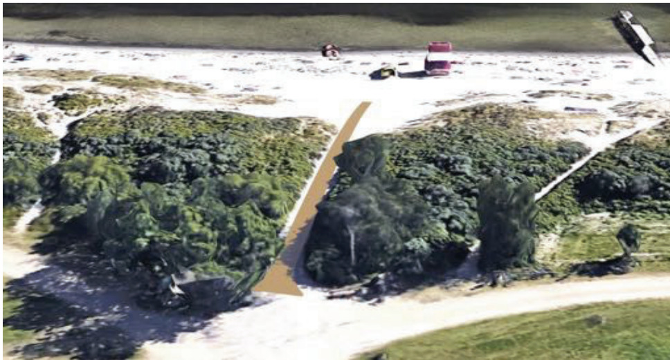
Fig.4 Visualisering af strandtæppet set ud mod kysten

Strandtæppet placeres 130 meter fra en sø og ca. 4,6 km til nærmeste Natura 2000-område nr. 143 Vestamager og havet syd for (Habitatområde H127, Fuglebeskyttelsesområde F111), jf. bekendtgørelse nr. 1595 af 6. december 2018 om udpegning og administration af internationale naturbeskyttelsesområder samt beskyttelse af visse arter.