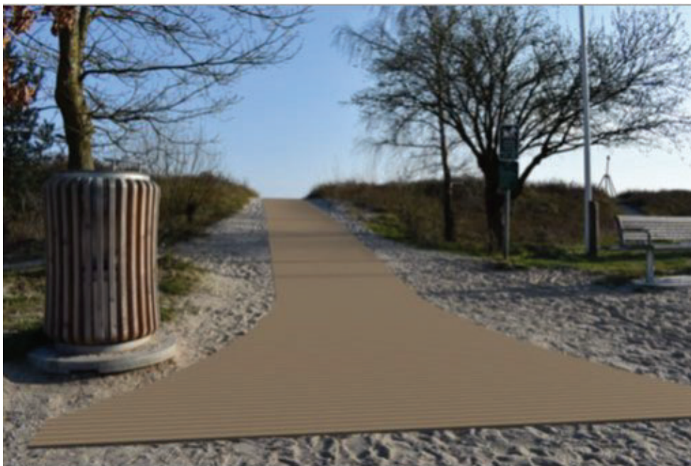
Fig.3. Visualisering af strandtæppet