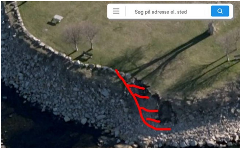
Placeringen af trappen ved rampen ”10” jf. tidligere luftfoto

Der ønskes anlagt en nedgang (trappe / skråningsrampe) fra pladsen ned til klippekysten. Ud over funktionen som trappe ønskes den evt. udstyret med 3 opholdsplateauer, hvor man kan sidde og se ud over kysten, således den også kan bruges som et mindre samlingssted, særligt under folkemødet. Trappen ønskes udført enten i jern, beton eller evt. træ i en bredde på 2 m (så trin kan anvendes som siddeplads) og opholdsplateauer ligeledes i 2 m bredde.