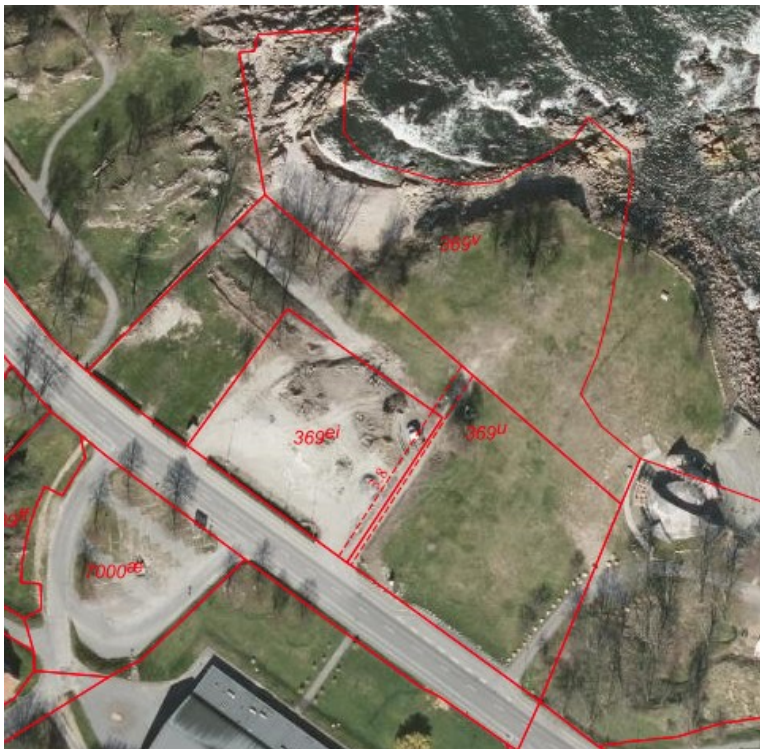
Cirkuspladsen med den fjernede benzintank

Der ansøges endvidere om yderligere mindre terrænændringer og om etablering af en trappe fra cirkuspladsen til klippekysten.