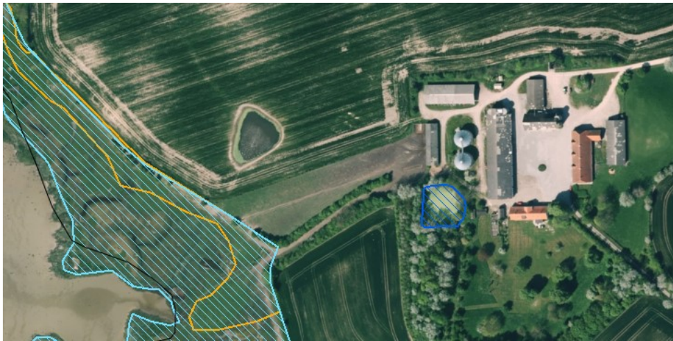
Luftfoto af området. Gul og blå skravering til venstre markerer strandeng og overdrev, hvor kvæget græsser.

Ejeren fortæller, at den gamle stald ønskes nedrevet, når den nye stald er opført. Det er planen, at det tiloversblevne areal, som ligger uden for strandbeskyttelseslinjen, skal bruges til to kornsilos, der skal supplere de to eksisterende, som også ses på luftfotos ovenfor.