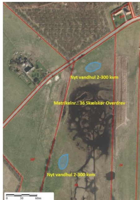
Justeret placering (jf. dispensationen) Ansøgers oprindelig placering

Ejendommen er beliggende i/op til Natura 2000-område nr. 162 - Skælskør Fjord og havet og kysten mellem Agersø og Glænø (habitatområde nr. 143, fuglebeskyttelsesområde nr. 95) jf. bekendtgørelse nr. 1595 af 6. december 2018 om udpegning og administration af internationale naturbeskyttelsesområder samt beskyttelse af visse arter.