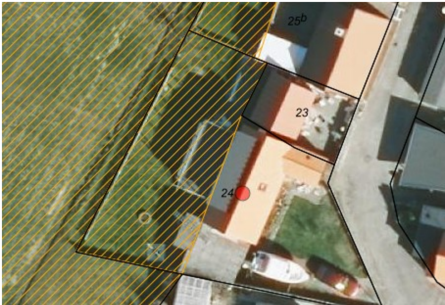
Luftfoto af ejendommen. Beboelsesdelen er markeret med en rød prik. Udestuen og terrassen ses vest for.