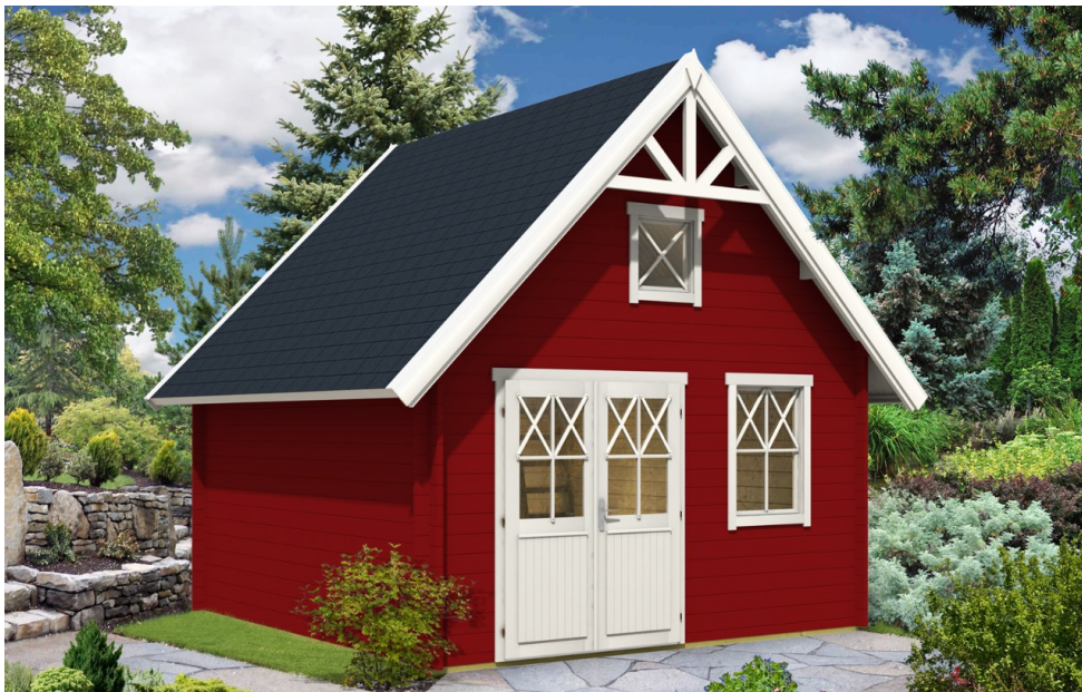
Udformning af ansøgt badehus

Eventuelle terrasser ved badeskurene må kun anlægges langs den ene side og højst i en dybde af 2,5 m og højst i samme længde som den side af badeskuret, hvor de er anlagt.