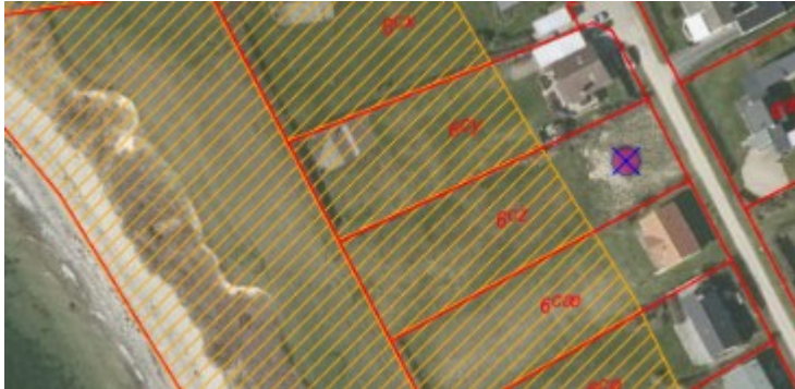
Figur 1. Luftfoto – forår 2019. Rød prik markerer matriklen. Orange skravering markerer strandbeskyttelseslinjen.

Ejendommen er delvist omfattet af strandbeskyttelseslinjen. Se figur 1.