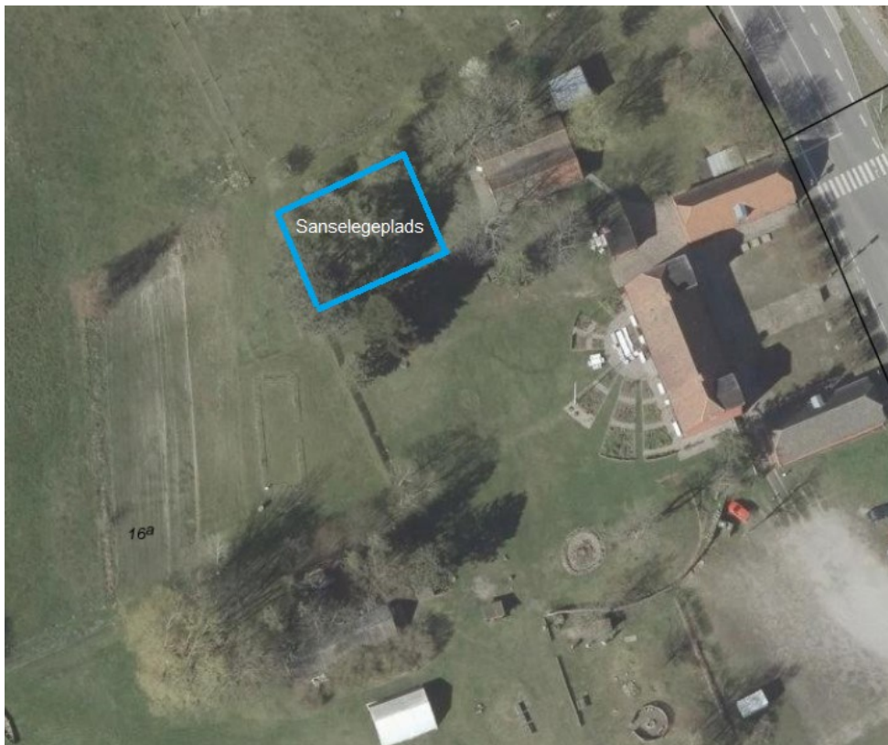
Oversigtskort 3. Viser placeringen af sanselegepladsen på ejendommen.

Halvcirklen/sanselegepladsen er etableret i museets nordlige ende af haven (se oversigtskort 3), og inddelt i forskellige historiske perioder, hvor der er opstillet elementer som knytter sig til de forskellige perioder. Sanselegepladsen er indhegnet af et ca. 80 cm højt hegn opført i naturmaterialer (pil og træ) med det formål, at etablere et sikkert og afgrænset rum hvor mindre børn frit kan lege, og hvor det er muligt at holde opsyn med børnene på et begrænset areal. Det er oplyst, at legepladsen vil blive sikkerhedsgodkendt af en legepladsinspektør.