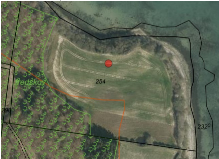
Figur 2, ortofoto 2019 med fredskovspligtige arealer med grøn signatur, 100 m strandbeskyttelseslinjen som orange streg

Tilplantningen sker alt overvejende indenfor den oprindelige 100 m strandbeskyttelseslinje.