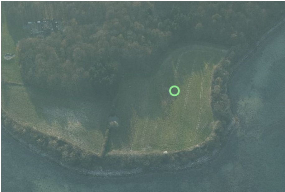
Figur 3, skråfoto fra 2019. Arealet ses med fredskov i ryggen og randbevoksning mod kysten

Tilplantningen sker med skånsom jordbearbejdning i normal pløjedybde, eller plantning i stub.