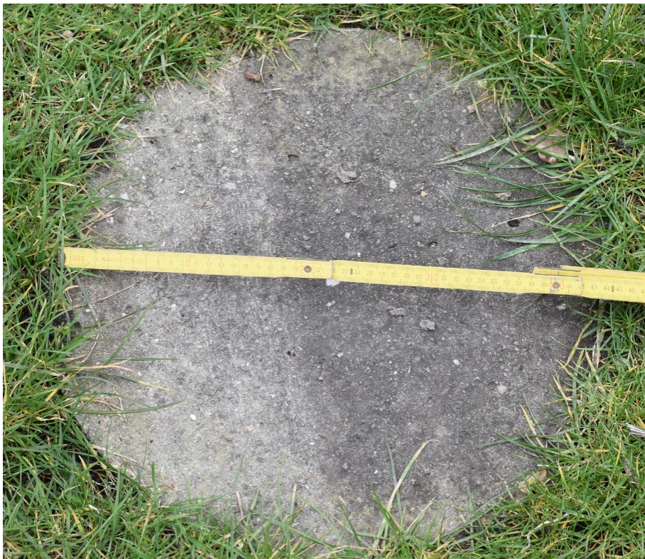
Figur 3. Dæksel i beton Ø45 jf. ansøgning

Dækslerne i beton har en diameter på Ø45 cm. jf. fremsendt billede af et lignende dæksel. Se figur 3.