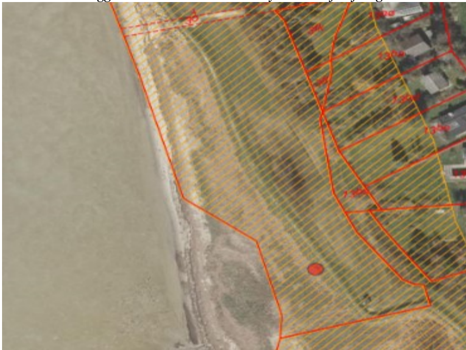
Figur 1. Strandbeskyttelseslinjen er markeret med gul skravering og matriklen er udpeget med rød prik.

Området er beliggende inden for strandbeskyttelseslinjen jf. figur 1.