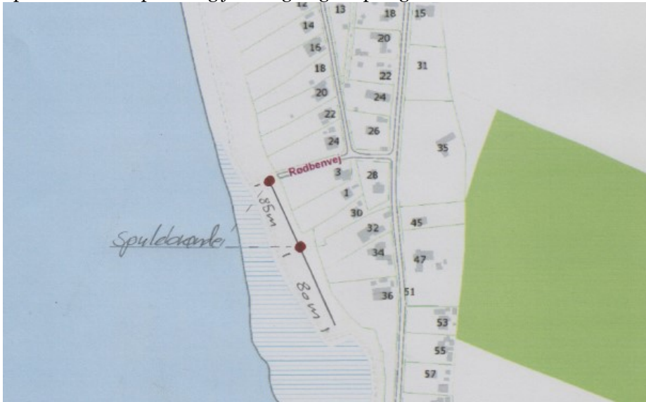
Figur 2. Placering af brønde er markeret med rød prik jf. ansøgning.

Spulebrøndenes placering jf. ansøgning ses på figur 2.