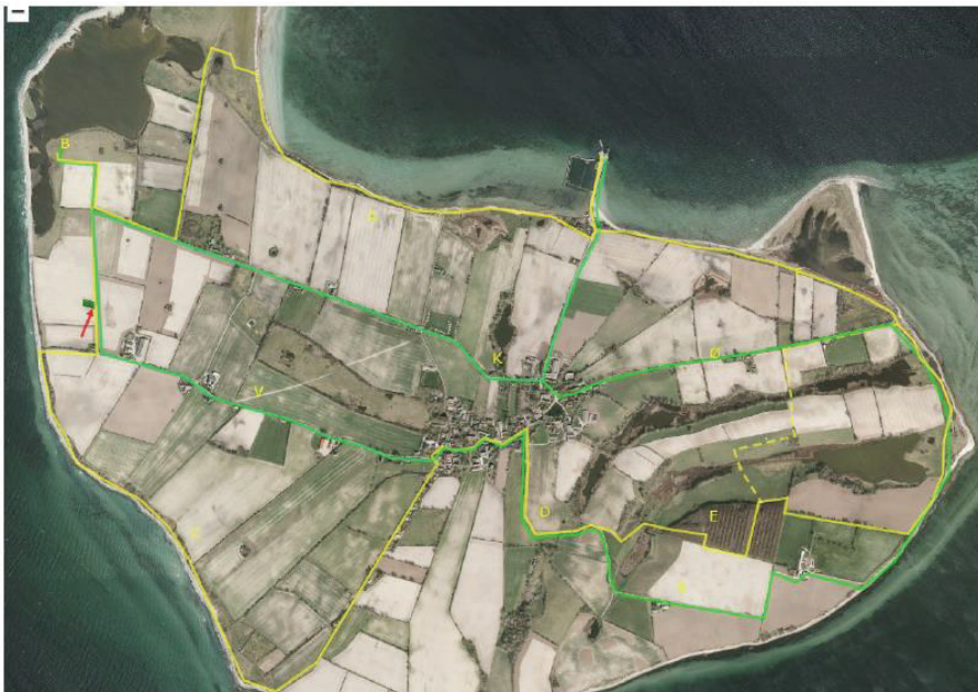
Figur 1. Luftfoto fra ansøgningen, der viser gul vandrerute og grøn cykelrute. Toilettes placering er markeret med rød pil mod vest

Toiletet i vest ønskes placeret ved Klokkestenen. Klokkestenen er kommunal grund og ligger på både cykel og vanderruten. Og så ligger den som endestationen for seværdighederne i vest. Samtidig kan der bakke en slamsuger til og tømme toiletet. Toiletet sættes i hjørnet af grunden skjult af buske ud mod marken og så langt fra Klokkestenen som muligt. Se figur 1-3.