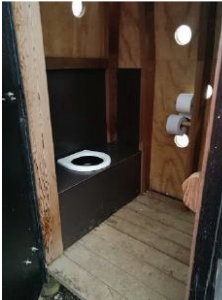
Figur 7. Foto fra ansøgningen, der viser eksempel på toiletbygning

Ejendommen er beliggende ca. 500 meter fra nærmeste Natura 2000-område nr. 197 Flensborg Fjord, Bredgrund og farvandet omkring Als (habitatområde nr. H173, fuglebeskyttelsesområde nr. F64), jf. bekendtgørelse nr. 1595 af 6. december 2018 om udpegnings og administration af internationale naturbeskyttelsesområder samt beskyttelse af visse arter.