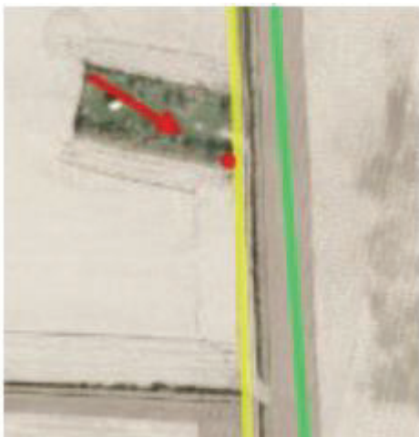
Figur 2. Luftfoto fra ansøgningen, der viser toilettes placering på matriklen