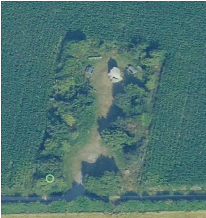
Figur 3. Skråfoto sommer 2019. Grøn ring markerer placering.

Der søges om et primitivt toilet 1,5 x 1,5 meter med nedgravet septiktank til tømning en gang årligt.