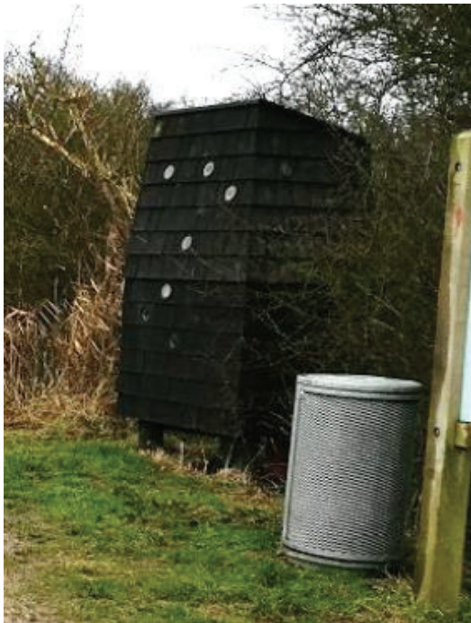
Figur 6. Foto fra ansøgningen, der viser eksempel på toiletbygning