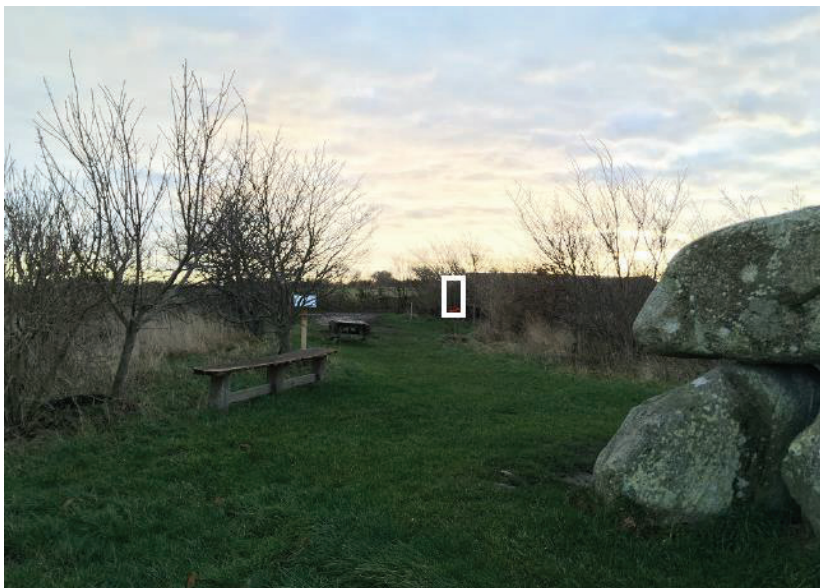
Figur 4. Foto fra ansøgningen, der viser placering af toilettet.

Farven er grå-sort og ses derfor næsten ikke i landskabet. Toilettet er på tegningerne vist med en hvid firkant, men den vil selvfølgelig forsvinde meget mere i naturen end vist på tegningerne. Se figur 4.