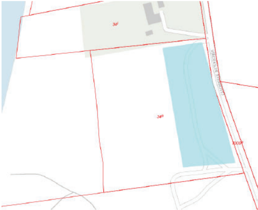
Figur 1. Matrikelkort fra ansøgningen, der viser start- og målområde.

Løbet vil taget sin start og slut ved parkeringspladsen ved Vindkilde Strandvej 21B, 4540 Fårevejle. Der vil i forbindelse med løbet blive opsat telte, pavilloner, toiletvogn samt anden konstruktion ved parkeringspladsen Ordrup strand, Højbjergvej 29, 4540 Fårevejle, til afvikling af løbet Endure Trail. Se figur 1 og 2.