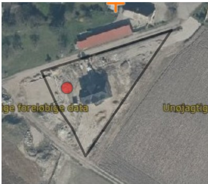
Figur 4, haveareal fra figur 3 med flyfoto 2020 og ny bolig