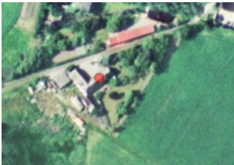
Figur 2, ortofoto 2002. Første foto efter den udvidede strandbeskyttelseslinjes ikrafttræden den 25. november 2001.