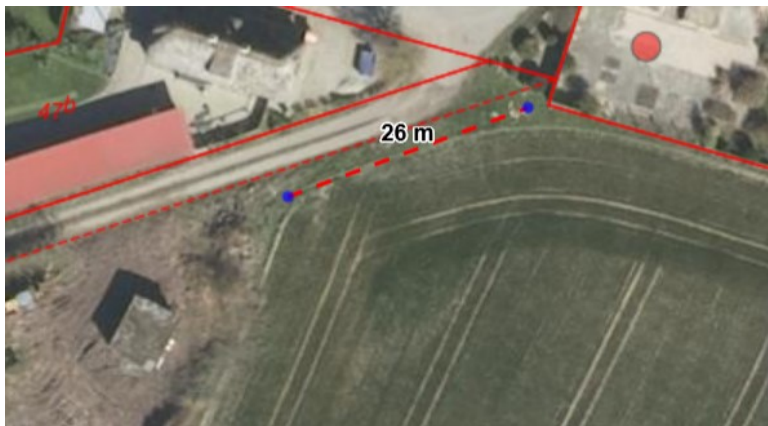
Figur 1, afstand mellem skel mod 50b og begyndelsen af haven, fra Kystdirektoratets afgørelse af 27. maj 2020

Kystdirektoratet traf den 27. maj 2020 afgørelse om, at de første omtrent 25 m langs grusvejen Tørvemosevej ind til ejendommen fra den asfalterede del af Tørvemosevej, som vist på nedenstående figur 1, ikke er have i naturbeskyttelseslovens forstand.