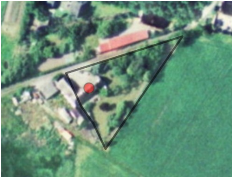
Figur 3, have og gårdsplads indtegnet på 2002 ortofoto