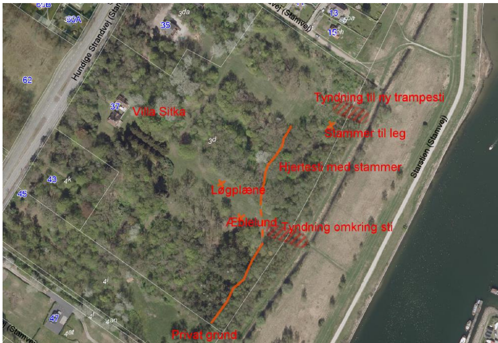
Fig. 2. Billede fra ansøgningen, der viser placeringen af nogle af de ønskede tiltag.