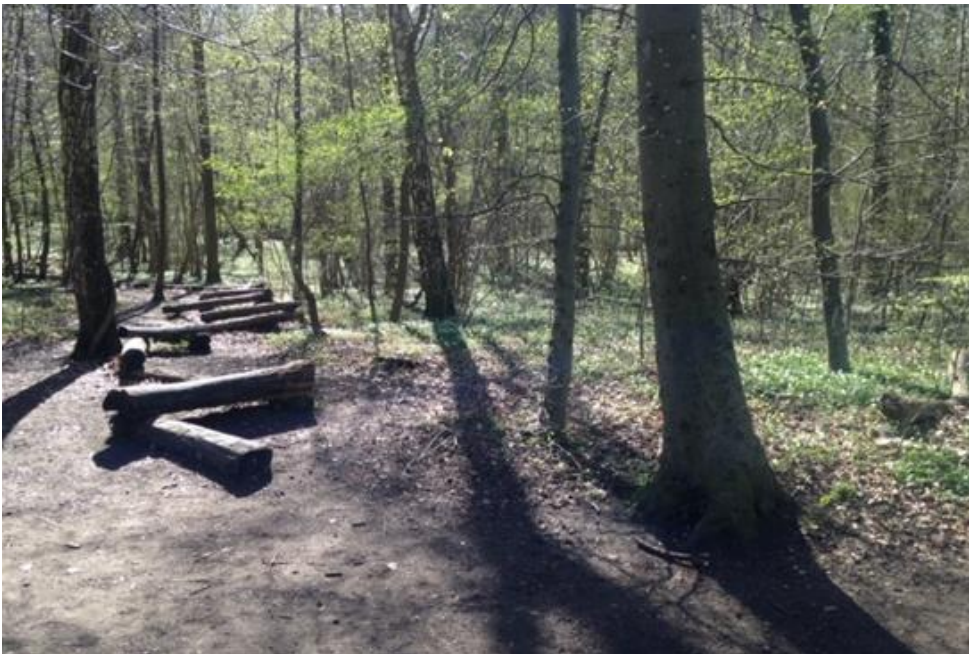
Referencefoto af træstammer i Boserup skov, som udlægning af træstammerne langs en eksisterende sti er inspireret af.