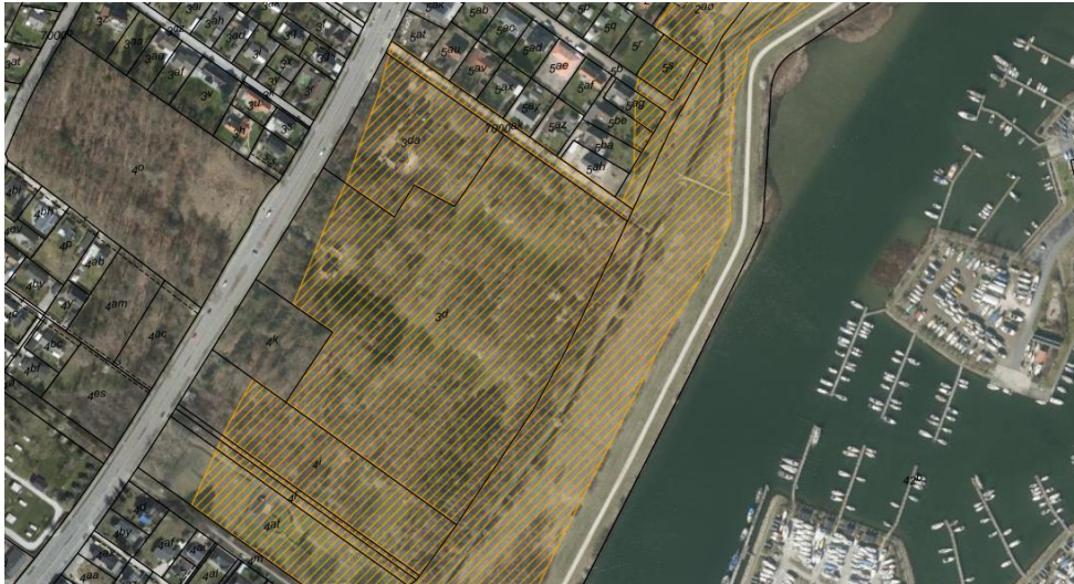
Fig. 1. Otofoto 2019. Det orange skraverede område markerer det strandbeskyttede areal. De sorte streger markerer matrikelskel.

Hundigeparken er delvist beliggende inden for strandbeskyttelseslinjen (se fig. 1).