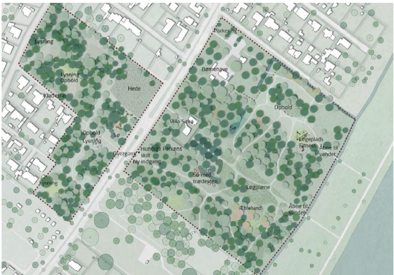
Fig. 3. Billede fra ansøgningen, der viser Hundigeparken og visse af elementerne i udviklingsplanen.