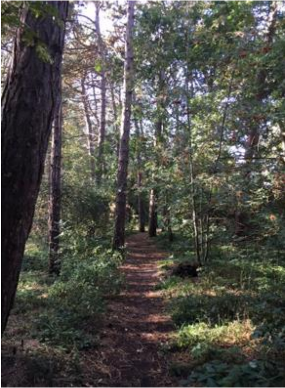
Eksisterende sti, hvor der lægges træstammer langs med.