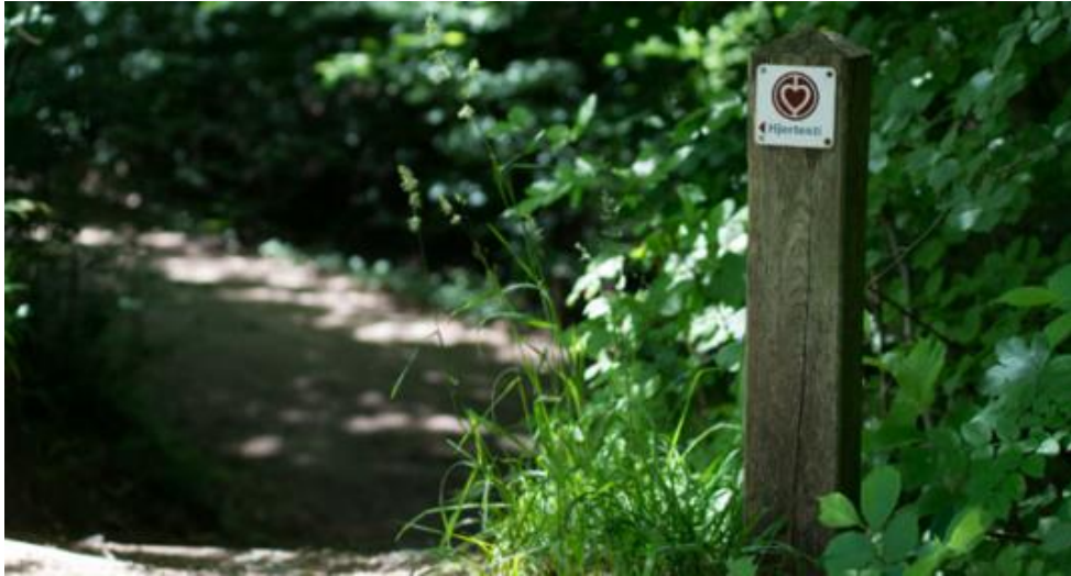
Foto af markeringspælene af hjertestien, der opsættes langs en eksisterende sti.