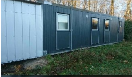
Figur 1. Foto fra ansøgningen, der viser eksempel på beboelsesvogn.

Der ansøges om midlertidig opstilling af beboelsesvogn i forbindelse med at ejendommens stuehus skal renoveres indvendigt. Se figur 1.