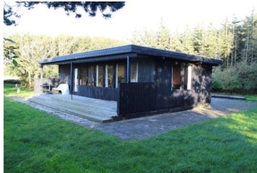
Set fra Syd-vest.

Det er ikke tanken at ændre bygningens udseende. Det skal forsat fremstå meget enkel med træbeklædte facader og fladt tag.