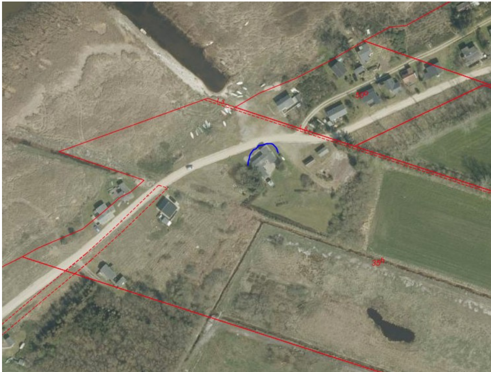
Ejendommen – stuehus markeret blå

Ejendommen er beliggende i/op til Natura 2000-område nr. 69 -Ringkøbing Fjord og Nymindestrømmen (habitatområde nr. 62, fuglebeskyttelsesområde nr. 43) jf. bekendtgørelse nr. 1595 af 6. december 2018 om udpegning og administration af internationale naturbeskyttelsesområder samt beskyttelse af visse arter.