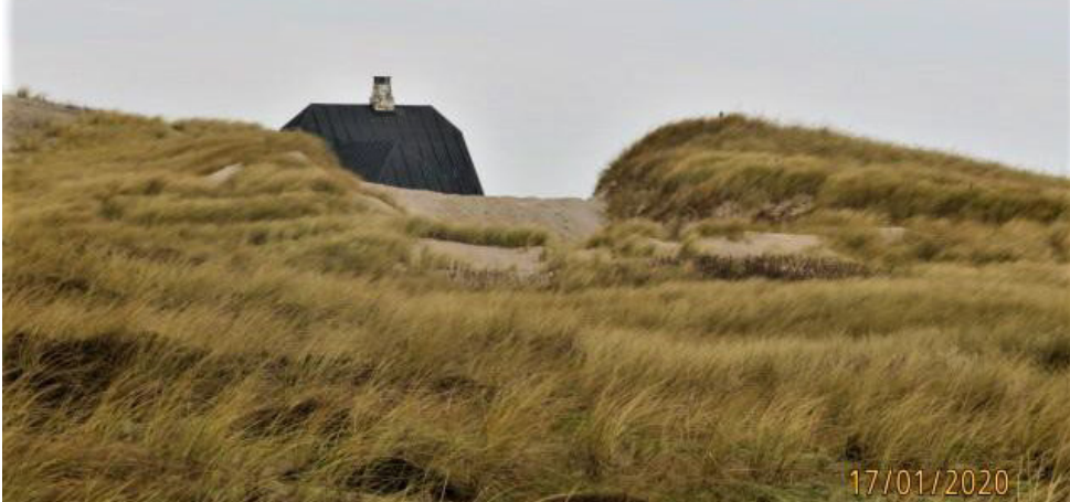
Foto fra ansøgningen, der viser hullet i klitten som der køres ud igennem. Fotoet er taget fra land mod stranden, og huset bagved er således Rævehulevej 34.

Af den nye ansøgning fremgår det at der nu ses mindre sandmængder i indkørslen