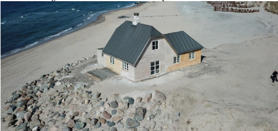
Foto fra ansøgningen, der viser Rævehulevej 34, samt til højre arealet mod indkørslen.

Arealet omkring selve huset fremstår nu som et plateau.