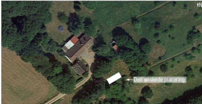
Figur 1. Luftfoto fra ansøgningen, der viser den ønskede placering.

Maskinhusets grundareal bliver 5 m x 12 m (60 m 2 ). Se figur 2-3.