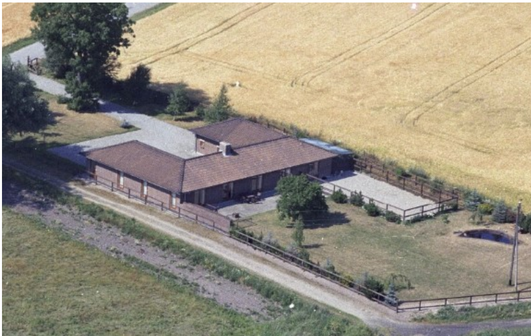
DK set fra luften 1989, med bebyggelsen inden genopførelse, jf. ovenstående dispensation. Dyrefolden mod vandet findes ikke i dag