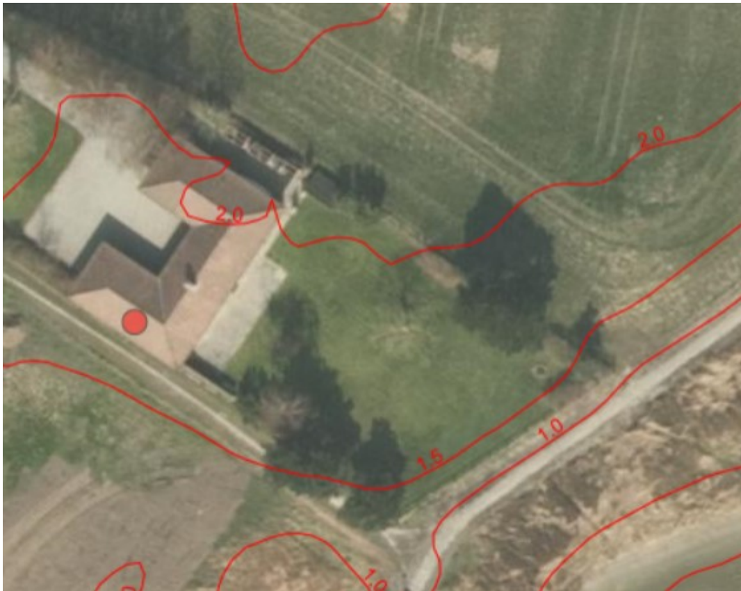
2019, ortofoto, huset ligger søværts den gamle strandbeskyttelseslinje. Vandet ses nederst til højre på luftfotoet. Højdekoter er lagt ind på kortet