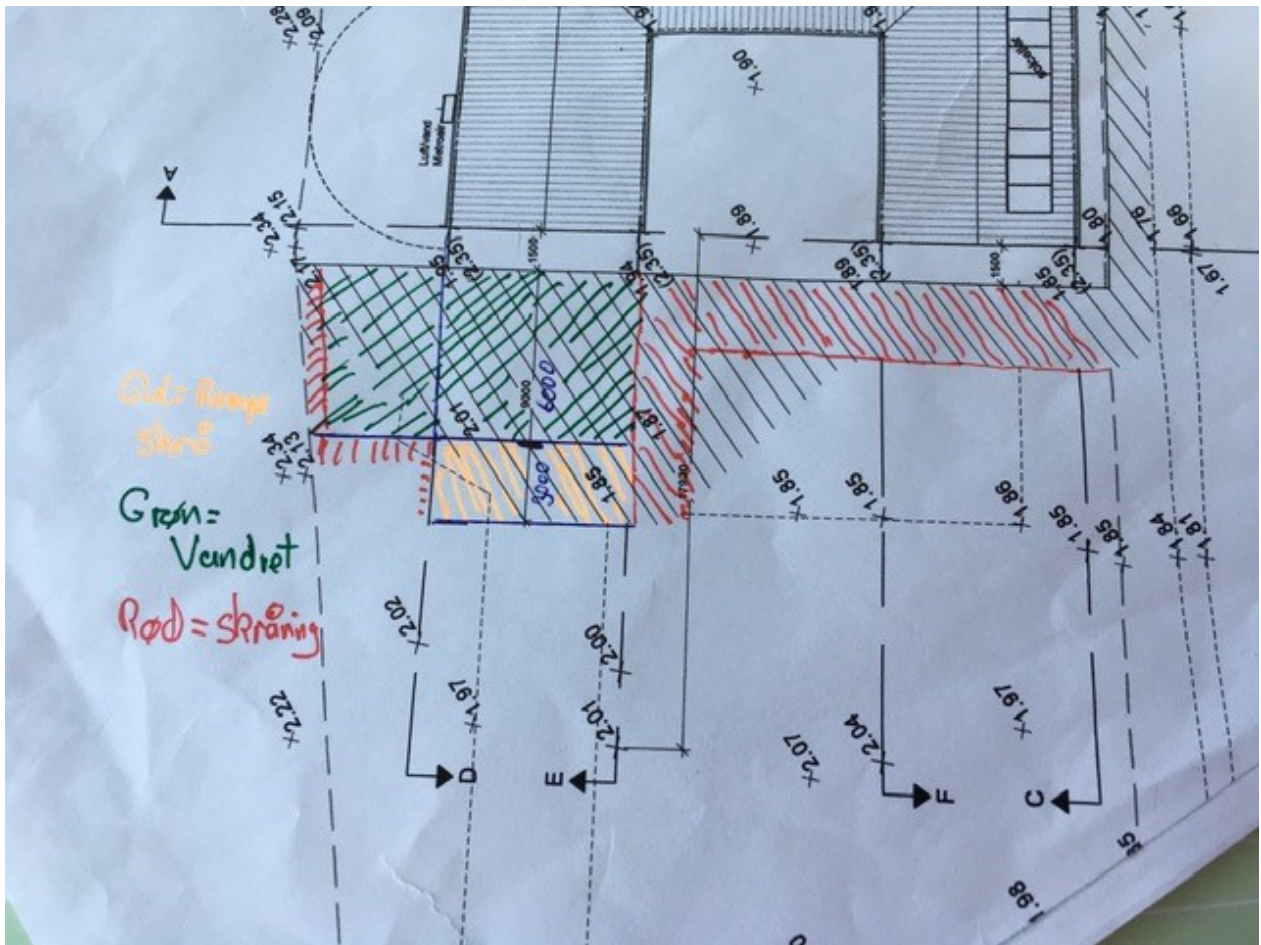
Ansøgers supplement til tilpasning af rådgivers udkast

Det ses af skitserne, suppleret med dialogen med ansøgers rådgiver og ansøger, at ansøger ønsker: