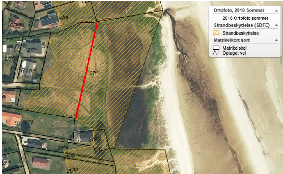
Figur 1 – ansøgt areal, der ønskes udstykket fra matr. nr. 27a Nr. Hurup By, Als (vest for den røde streg), strandbeskyttelse på matr. nr. 27a går helt ud til kysten, selv om dette ikke vises på kortet/luftfotoet.

Kystdirektoratet har anmodet ejeren oplyse, om ansøgningen skulle betragtes som en anmodning om genoptagelse af direktoratets tidligere trufne afgørelse, jf. ovenfor.