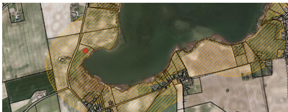
Fig. 1. Ortofoto 2019. Den røde prik markerer placeringen af minivådområdet. Det orange skraverede område markerer det strandbeskyttede areal. De umatrikulerede arealer ud til kysten samt stranden er dog også omfattet af bestemmelserne om strandbeskyttelse. De sorte streger markerer matrikelskel.

På den ovennævnte matrikel ønskes der etableret et minivådområde beliggende ud til Stege Nor. Minivådområdet ønskes konstrueret med lavvandede områder vekslende med bassiner med større dybde samt et sedimentationsbassin (se fig. 1-2).