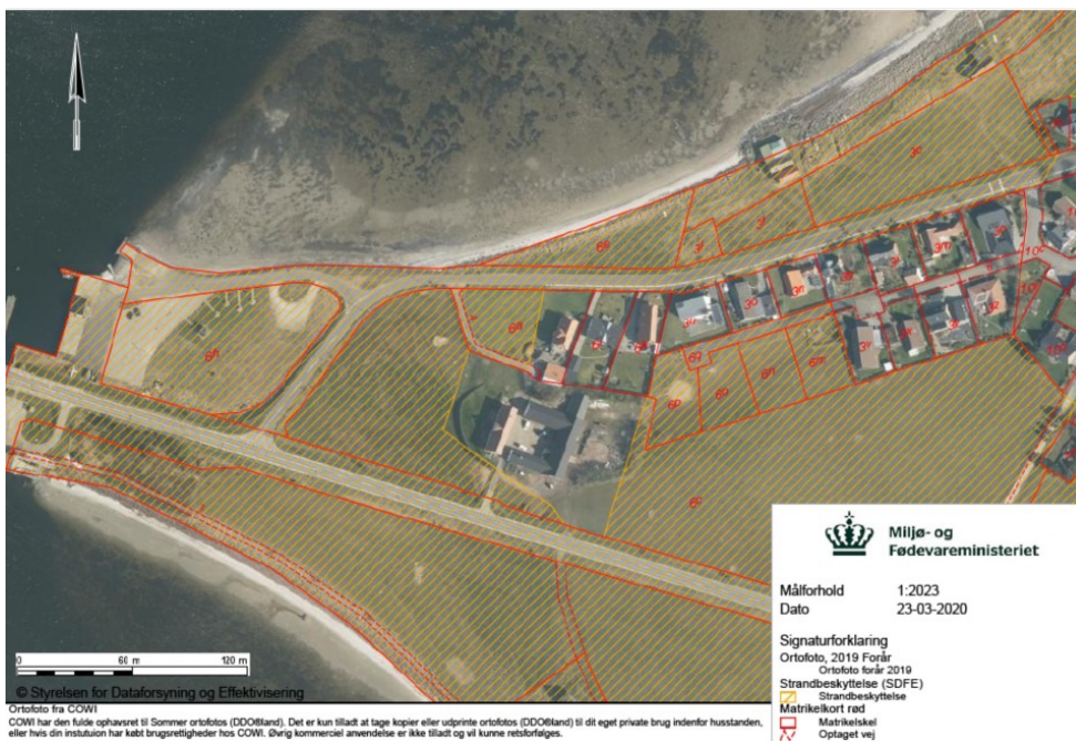
Fig. 1. Luftfoto over området ved Sundstrup, der ønskes benyttet. Røde streger afmærker matrikler, hvor orange skravering angiver strandbeskyttelseslinjen.

Ansøger forventer at der kommer 500-600 besøgende i løbet af dagen. Det store telt sættes op den 14. maj 2020 og tages ned den 18. maj 2020 – datoerne er bestemt af teltudlejningsfirmaet. Selve festivalen er den 16. maj 2020.