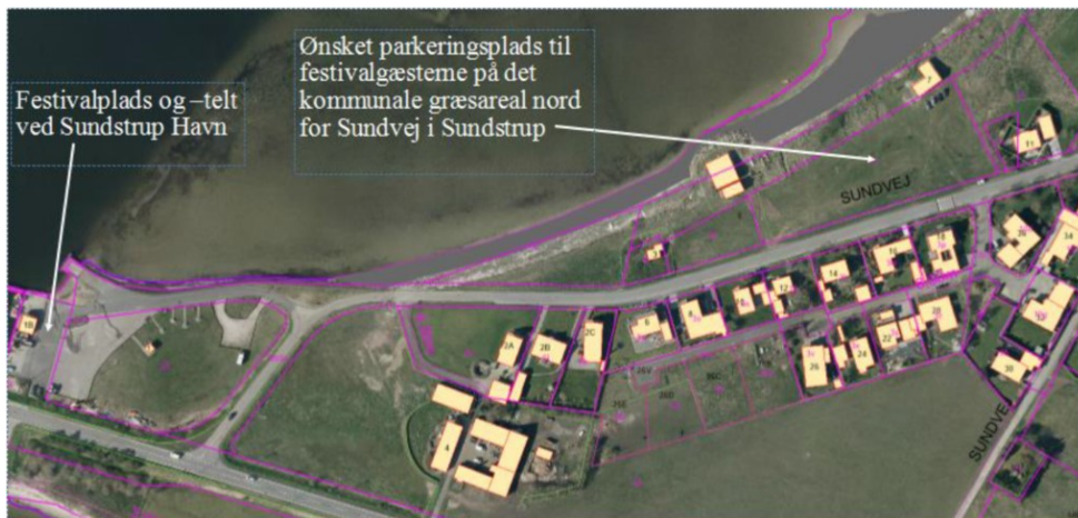
Fig. 2. Oversigtskort fra ansøger som viser placering af festivalplads ved Sundstrup Havn og den ønskede placering for parkeringsplads.