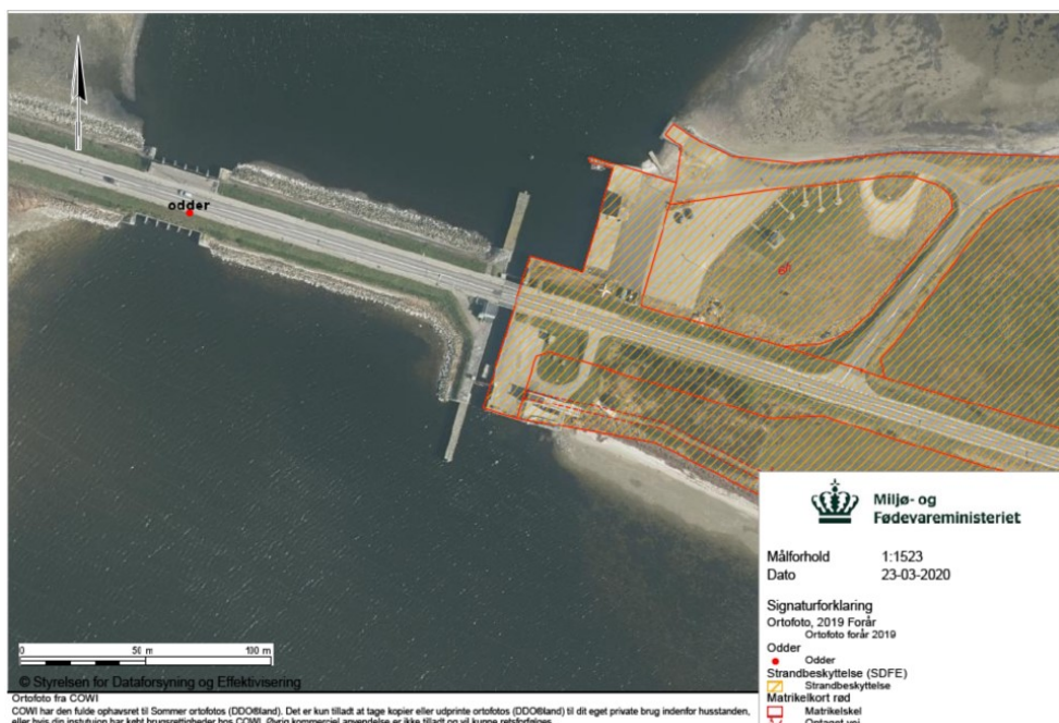
Fig. 5. Kort over Sundstrup Havn, hvor registreringen af odder ses.