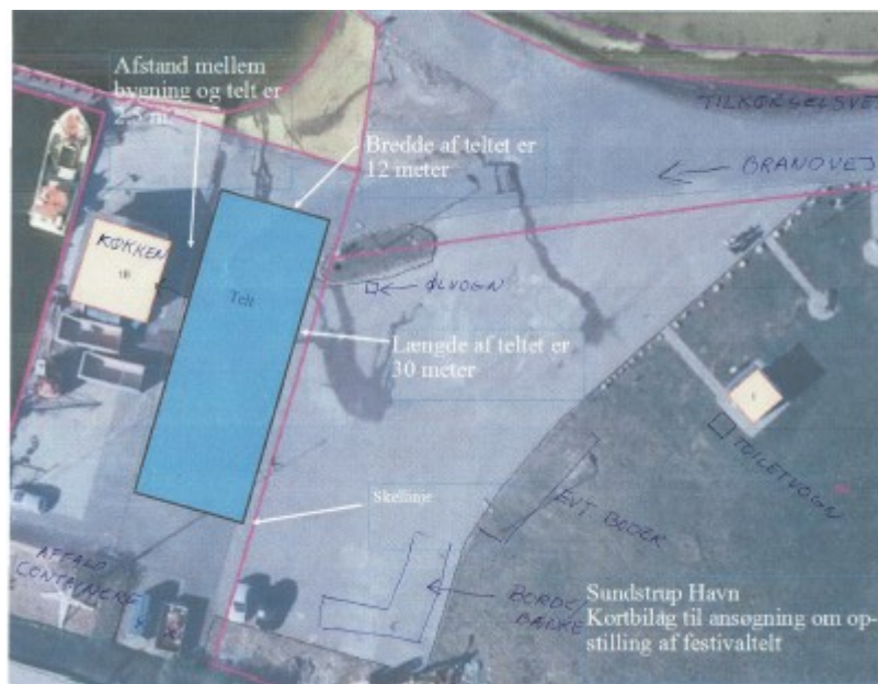
Fig. 3. Oversigtskort over festivalpladsen. Det ønskede telt ses som den blå firkant, og de andre faciliteter er ligeledes indtegnet på kortet.

Der er i den nordlige del af matr. nr. 3c registreret en mindre del §3 beskyttet strandeng (Naturbeskyttelsesloven). Derudover er noget af Sundstrup havne areal registreret som Natur- og Vildtreservat Hjarbæk Fjord.